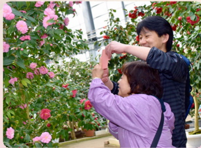
↑スマートフォンでピンク色の椿をパシャリ!