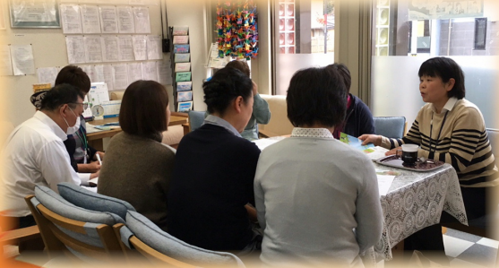
介護センター内での研修