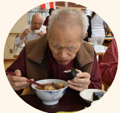
二刀流で頂きます