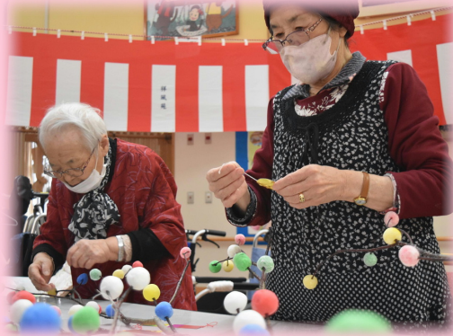
さあどこにつけっぺね