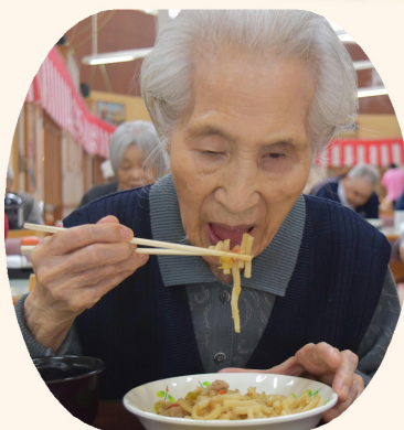
とっても美味しいです