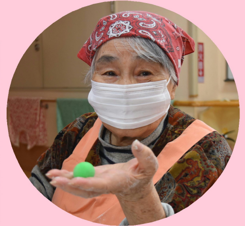
こんなんでもいいべがね~