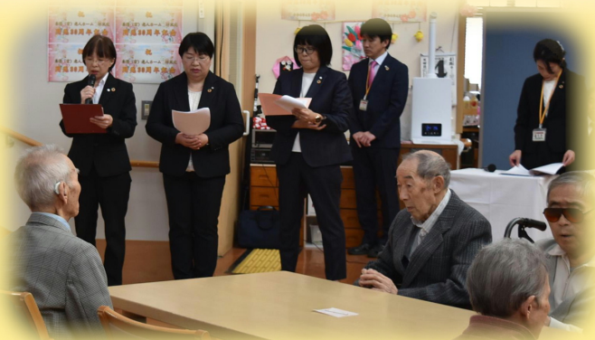
開苑当時を朗読で振り返りました。